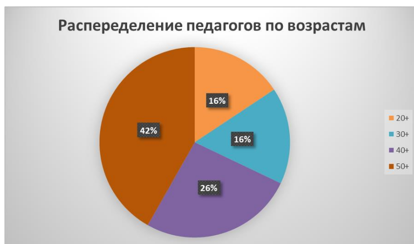
Диаграмма 2. Стаж работы по специальности